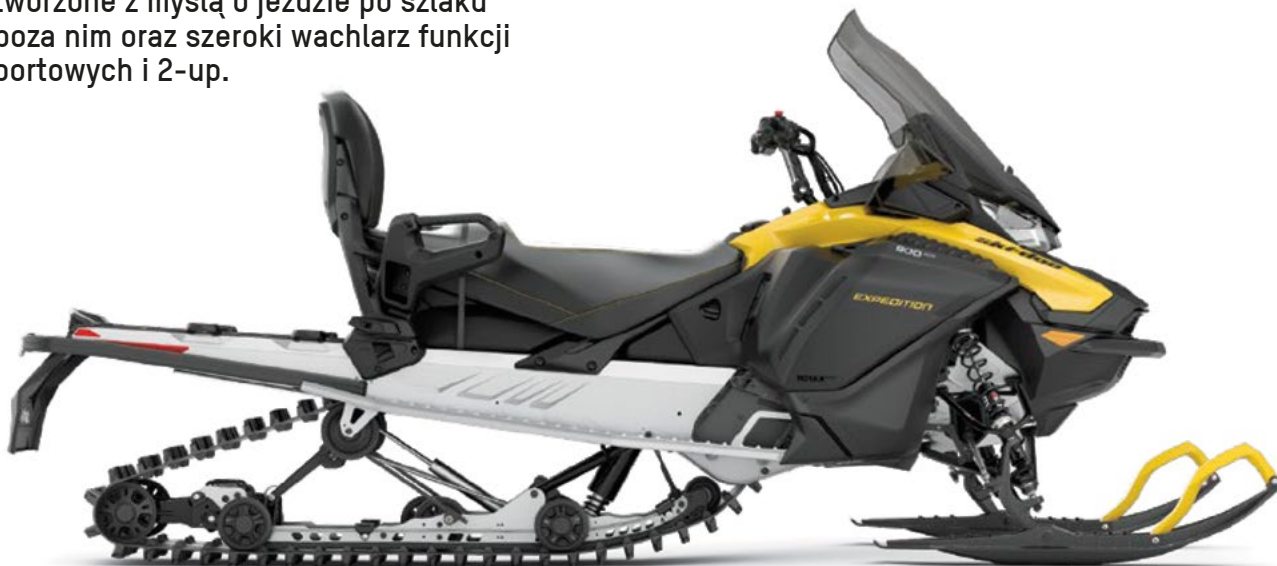
NA ZDJĘCIU ZAPREZENTOWANO MODEL EXPEDITION SPORT Z SILNIKIEM 900 ACE

Niezwykle responsywne podwozie stworzone z myślą o jeździe po szlaku i poza nim oraz szeroki wachlarz funkcji sportowych i 2-up.