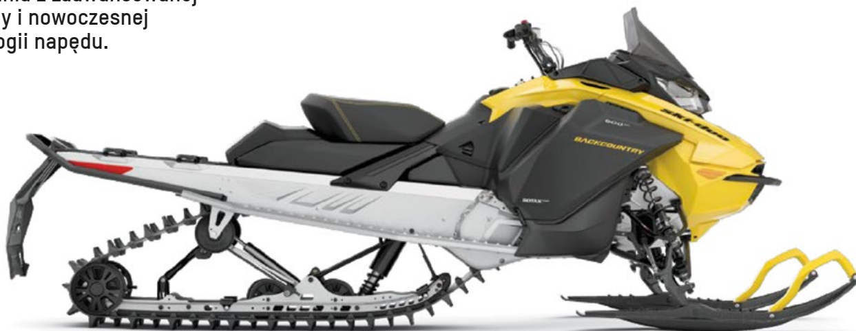
NA ZDJĘCIU ZAPREZENTOWANO MODEL BACKCOUNTRY SPORT 146 600 EFI

Dla użytkownika, dla którego liczy się wszechstronność i możliwość korzystania z zaawansowanej platformy i nowoczesnej technologii napędu.